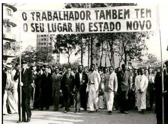
Trabalhadores homenageiam Vargas na Esplanada do Castelo, 1940. Rio de Janeiro (RJ).