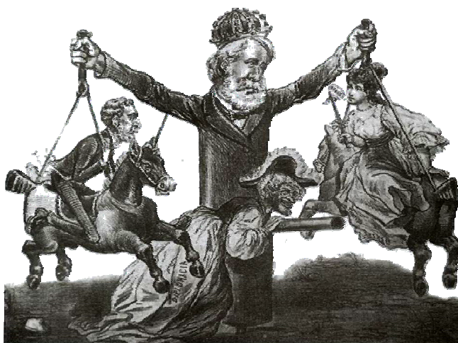
FARLA, Cândido de A. Carticatura publicada em O Alcegaço, dia 08/01/1978. Fundação Biblioteca Nacional, Rio de Janeiro.